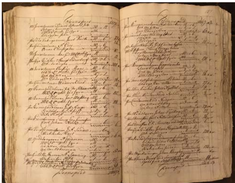
Bergstrahlska huset vid Riddarhustorget rymde både vinstuga och kaffehus. I kronotaxeringslängden återfinns förebilderna till flera av Bellmans personager.