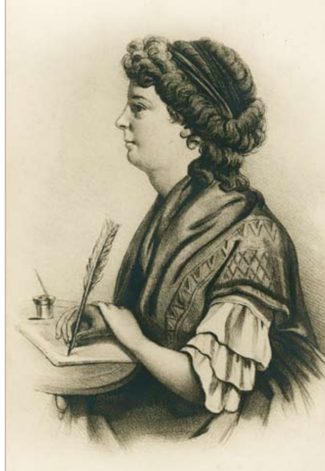
När fru Lenngren skrev om Bellman var det knappast välvilligt. Vykort.