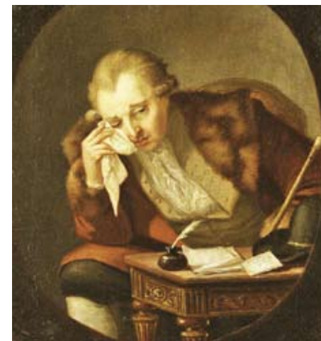
Bellman författar ett sorgkväde över Viborgska gatloppet. Pehr Hilleström, 1790. (Nat.mus.)

Musikaliska illustrationer av Carl Håkan Essmar